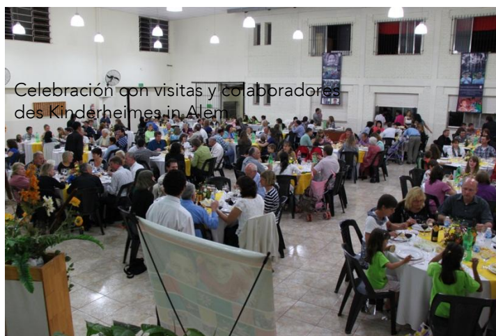
Celebración con visitas y colaboradores des Kinderheimes in Alem