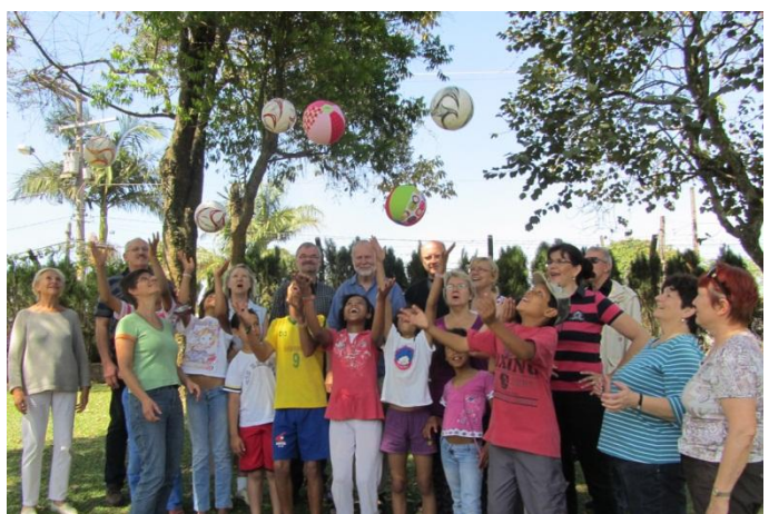
Hnos. Europeos con niños en Cotia

2. Viaje misionero – durante la primera etapa del viaje, del 4 al 12/10, compartimos el mismo con el grupo de hermanos europeos que nos visitó. Eso fue de gran bendición. Visité con ellos los proyectos en San Pablo (Hogar de Niños en Cotia y Centro Social en Diadema), como también algunos proyectos en el norte de Argentina, por ejemplo la obra misionera en El Soberbio, la misión entre los aborígenes Guaraníes y el Hogar de Niños en Alem. A la mayor brevedad posible les haré llegar también un informe de este grupo de hermanos.