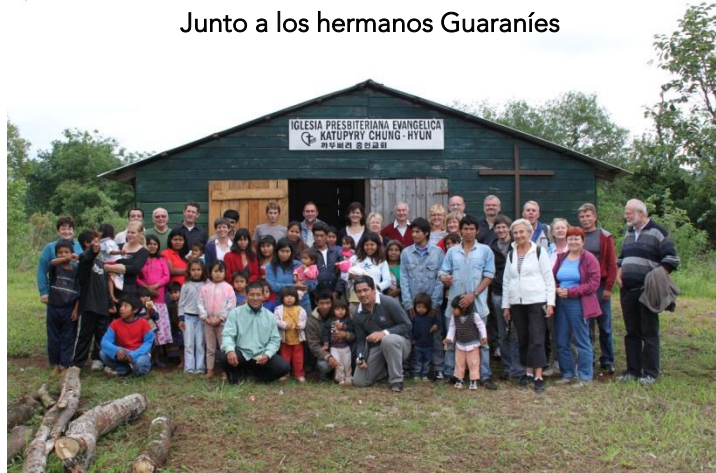
Junto a los hermanos Guaraníes